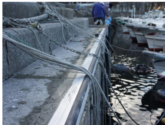
施工後 (1日で78.5mを完了しました)