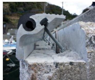
コーナー材取付状況

今回コーナー材が未設置の漁港において、供用しながらの工事を求められ、この工法が採用されました。