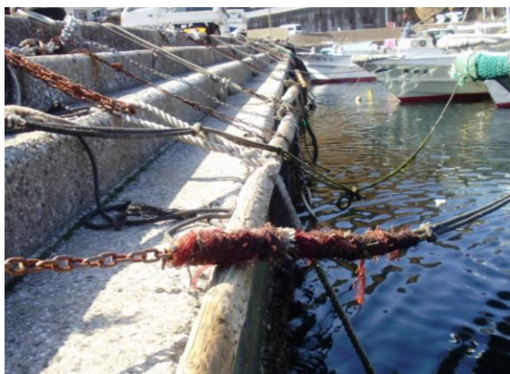
施工前 (J-材の代わりに木を吊下げていました)