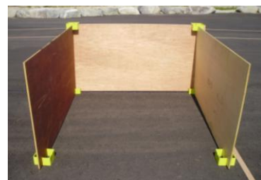
コンパネを使用することも可能