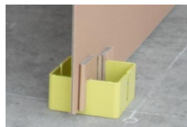
固定用ブロック(角形鋼管製)