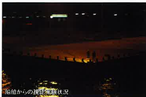
船舶からの視認実験状況