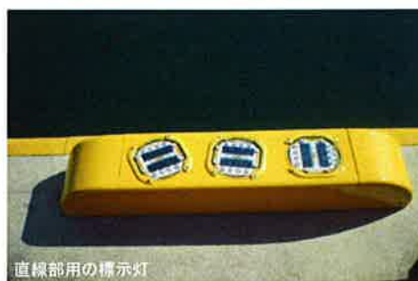
直線部用の標示灯

新製品開発や改良・工夫など様々な取り組みを発信する為に、未来航路ニュースを発刊する事になりました。ご意見やお問い合わせがありましたら下記連絡先までご連絡ください。より安全で快適な港湾空間を創造するために努力してまいります。今後ともよろしく申し上げます。