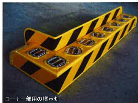
コーナー部用の標示灯